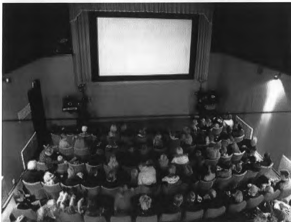
Mariannelunds anrika biograf digitaliseras med stöd av Eksjö kommun, Videvox och Svenska Filminstitutet, september/okt 2012.