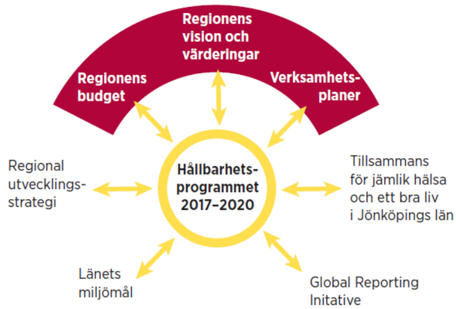
Figur 1: Region Jönköpings läns program för hållbar utveckling innehåller mål som är unika för programmet, men det har även hänvisningar till mål som finns framtagna i våra övriga styrande dokument. Tillsammans ger målen en samlad bild av Region Jönköpings läns hållbarhetsarbete.